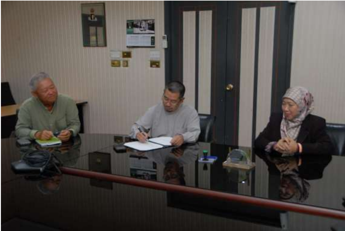
Gambar 1: Menandatangani sebagai saksi perjanjian dari pihak Jabatan Pertanian dan Agrimakanan oleh Yang Mulia Saidin bin Namit, Pemangku Timbalan Pengarah Pertanian dan Agrimakanan.